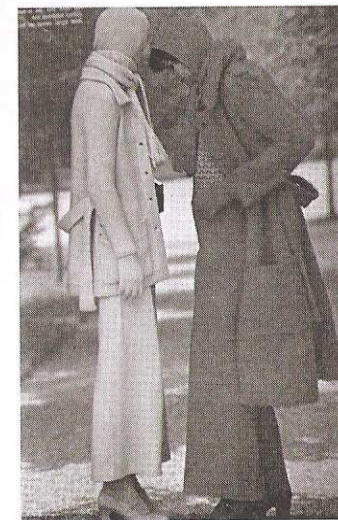
Figura 57. Pantalones pata de elefante con sacos largos tejidos.