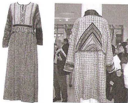
Figuras 59 y 60. Diseños de Mary Tapia.