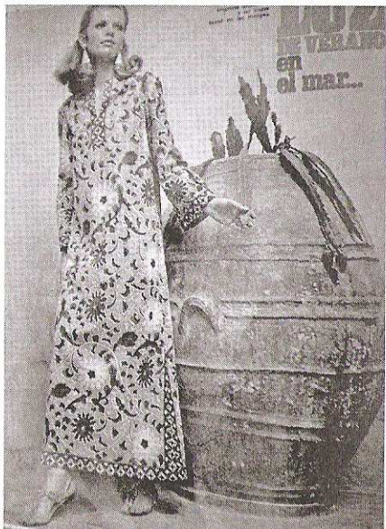
Figura 54. Revista Para Ti , N° 2418, noviembre 1968.