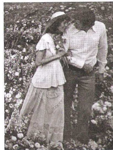
Figura 56. Década del '70. Revista Para Ti .