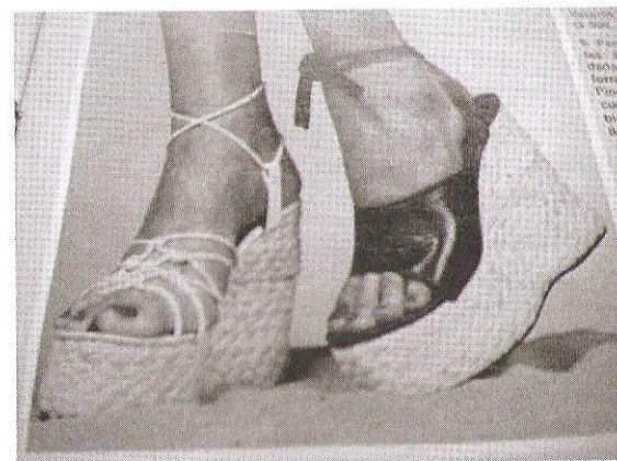
Figura 55. Fuente: Revista Para Ti .