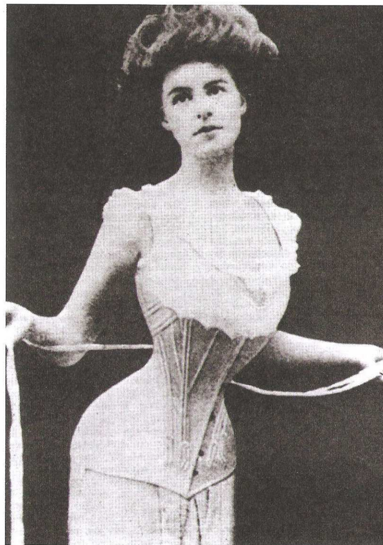
Figura 6. Corset, circa 1900.