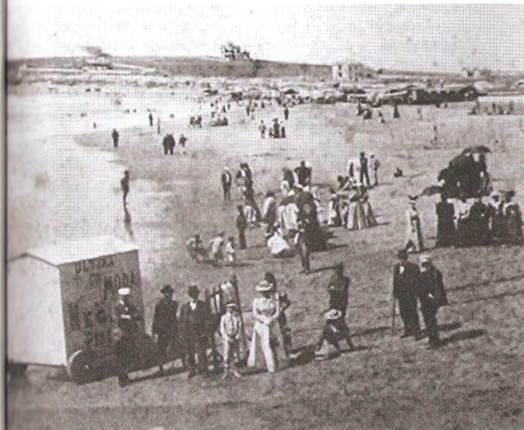
Figura 1. Mar del Plata 1885. AGN.