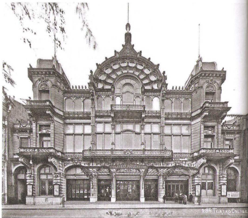
Figura 2. Teatro Coliseo, 1910, AGN.

gobierno nacional para destinar su predio al Banco Nacional, hoy Banco de la Nación Argentina. Con el monto obtenido por la expropiación se proyectó construir otro con el mismo nombre frente a la Plaza Lavalle encargándosele el diseño al Arq. Tamburini, al que sucede el Arq. Meano después de su muerte, y luego de muchas vicisitudes y la trágica muerte de Meano es concluido por el arquitecto belga Jules Dormal quien le da una impronta afrancesada al planteo original italianizante. El teatro es una vitrina donde se expone la alcurnia, y pertenecer a este entorno daba beneficios sociales.