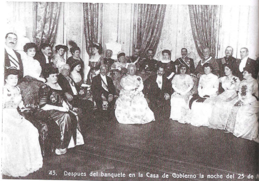
43. Después del banquete en la Casa de Gobierno la noche del 25 de M

Figura 3. Después del banquete en la Casa de Gobierno la noche del 25 de Mayo.