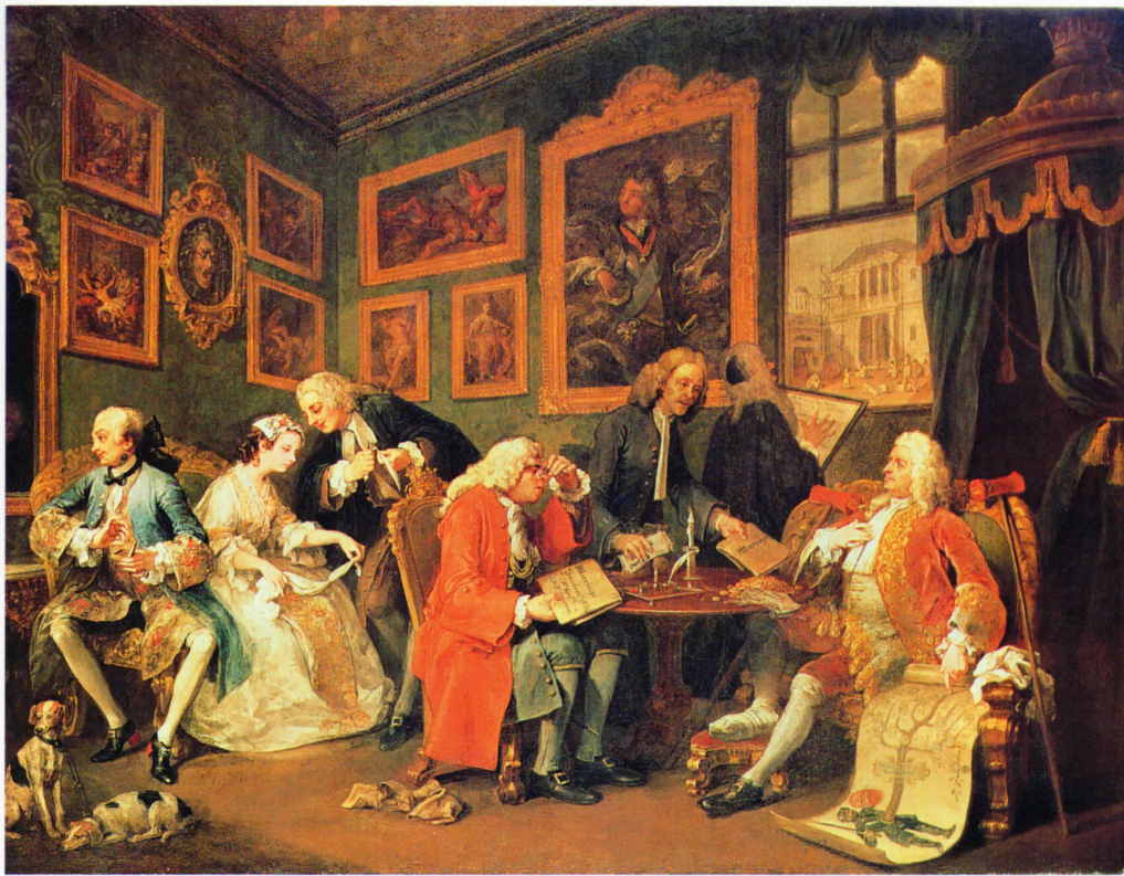
William Hogarth, El contrato matrimonial , 1743-45. Óleo sobre lienzo, 68,6 x 88,8 cm. National Gallery, Londres

En una serie de 6 cuadros Hogarth explica la historia (ficticia) de un matrimonio de conveniencia, que acabará violenta y mortalmente, entre el hijo de un conde y la hija de un rico comerciante. Los cuadros sirvieron de modelo a la serie correspondiente de grabados en cobre, que fueron encargados anticipadamente, incluso antes de que el pintor los hubiera terminado y encontraron gran aceptación en toda Europa.