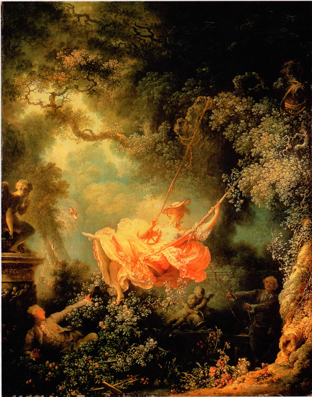
Jean-Honoré Fragonard, El columpio 1767 Óleo sobre lienzo, 81 x 65 cm Wallace Collection, Londres

Fragonard es el pintor del rococó alegre y festivo. Supo convertir acciones y situaciones corrientes en escenas estéticas y elegantes, que únicamente estaban al servicio de la belleza y del amor. La preferencia por las escenas eróticas sin escrupulosidad, el ritmo veloz de sus cuadros y la insistencia en que el arte obedece a leyes propias que no requieren el empleo de recursos embellecedores de la mitología antigua lo convierten en uno de los intérpretes más significativos del cuadro de costumbres de su tiempo.