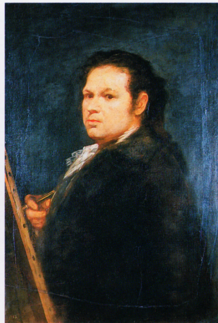
Autorretrato , 1783. Óleo sobre lienzo, 80 x 54 cm. Musée des Beaux-Arts, Agen

Saturno devorando a sus hijos , 1821 Óleo transportado del muro al lienzo, 146 x 83 cm. Museo del Prado, Madrid