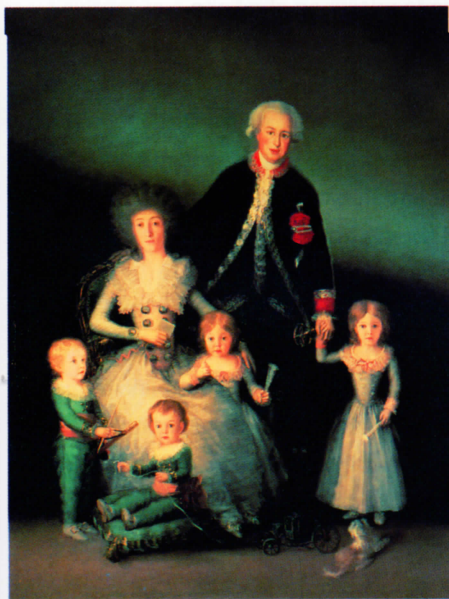
La familia del duque de Osuna , 1788. Óleo sobre lienzo, 225 x 174 cm. Museo del Prado, Madrid

sus raíces en el Renacimiento . En el cuadro de Goya no hay nada que distraiga la mirada de la sensualidad abierta y de erotismo de la retratada; en la habitación no se encuentran adornos ni firuletes ni voluminosos accesorios textiles. La mujer observa al espectador con tranquilidad y seguridad dejando espacio para cualquier tipo de fantasías. A La maja desnuda se la calificó de "pintura obscena" por lo que el pintor tuvo que presentarse ante la Inquisición en 1814.