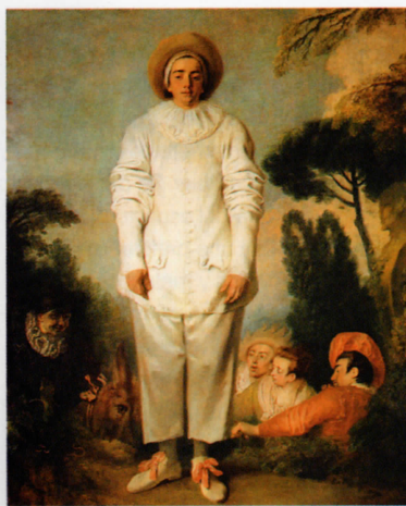
Jean Antoine Watteau, Gilles , 1718-19. Óleo sobre lienzo, 184 x 149 cm. Musée du Louvre, París