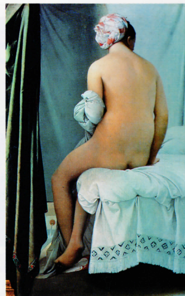
Jean Auguste Dominique Ingres, La gran bañista de Valpinçon , 1808. Óleo sobre lienzo, 146 x 98 cm. Musée du Louvre, París

En la intersección de esta época de transición y fuera de una etiquetación estilística determinada se encuentra el pintor Francisco de Goya. Este pintor español siguió su camino sin ser un apasionado del neoclasicismo pero dejando atrás el ilusionismo del barroco. Aunque su pintura está llena de la dramática luminosidad y del fulminante colorido de los pintores del barroco, sus temas son terrenales, comprometidos y, a pesar de su soltura pictórica, cuando pretende denunciar la situación de un país socialmente atrasado, su pincel se muestra severo.