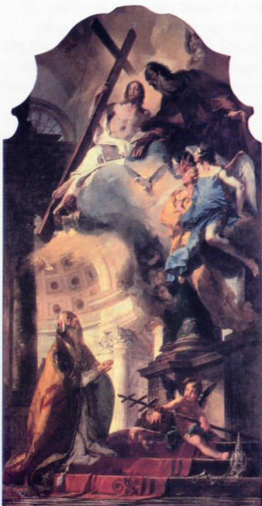
Giovanni Battista Tiepolo, San Clemente Papa adora la Trinidad , 1739. Óleo sobre lienzo, 488 x 256 cm. Alte Pinakothek, Colección pictórica estatal de Bavaria, Munich

Aunque los pintores del rococó fueran menospreciados por sus "ilustrados" contemporáneos a causa de la frivolidad y de la glorificación de la prodigalidad de la aristocracia, debe considerarse que las obras como El columpio de Fragonard o los sensuales desnudos de Boucher son al mismo tiempo una insurrección provocadora contra la moral de la Iglesia y, desde este punto de vista, contienen la misma idea ilustradora que la defendida por los filósofos de su tiempo, como por ejemplo Rousseau y Voltaire. Éstos exigían al hombre que tuviera "valor para pensar por sí mismo" y que no se limitara a depositar su confianza en las obsoletas concepciones ideológicas y doctrinas de la Iglesia y de la nobleza, sino que volviera a recuperar las capacidades recibidas por la naturaleza: el pensamiento y el intelecto. "Retour à la nature vuelta a la naturaleza" es lo que reclamaba Rousseau, con lo que en ningún caso se refería a retroceder a un estado de civilización primitiva, sino que, en vistas de la forma de vida cortesana, era necesario abandonar la hipocresía y volver a la sencilla naturalidad.