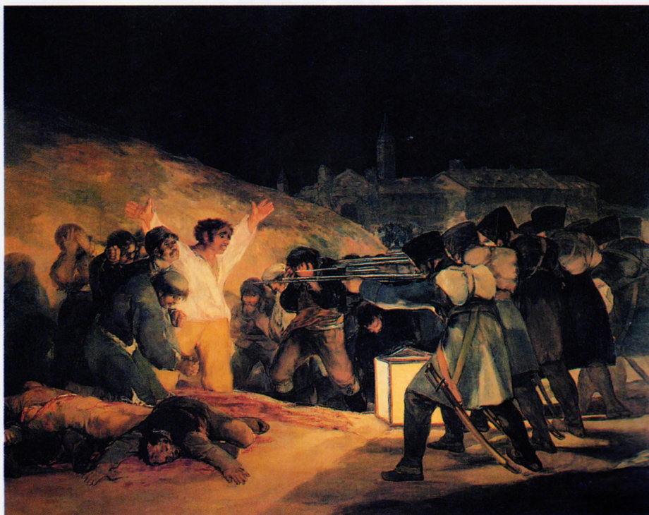
Fusilamientos del 3 de mayo de 1808 , 1814. Óleo sobre lienzo, 266 x 345 cm. Museo del Prado, Madrid

En su deseo de alejarse de una sociedad regida por el absolutismo político, Goya se refugió tras la Guerra de la Independencia de 1808 en su casa del otro lado del Manzanares, la Quinta del Sordo (apodada así en virtud de la sordera que sufría desde hacía veinte años) hasta 1823, en que se inició la represión absolutista. Entonces el pintor se instaló en Burdeos, donde residió hasta su muerte en 1828.