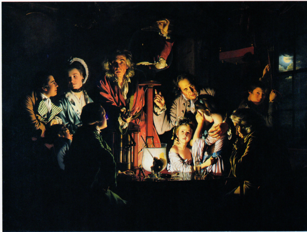
Joseph Wright of Derby, El experimento con la bomba de aire , 1768. Óleo sobre lienzo, 183 x 244 cm. National Gallery, Londres

El físico, que con su ondulado pelo gris y el abrigo rojo se asemeja a un mago, creó una situación de vacío en un matraz de cristal, con ayuda de una bomba de aire que se encuentra a la izquierda de la mesa. Para hacer visible la falta de aire, colocó un pájaro en el matraz que se iba asfixiando a lo largo del experimento. A pesar de todo, en este momento abre la tapa y el animal comienza a restablecer sus fuerzas gracias a la entrada de oxígeno. El grupo de curiosos rodea la mesa en un semicírculo que acaba cerrando el espectador.