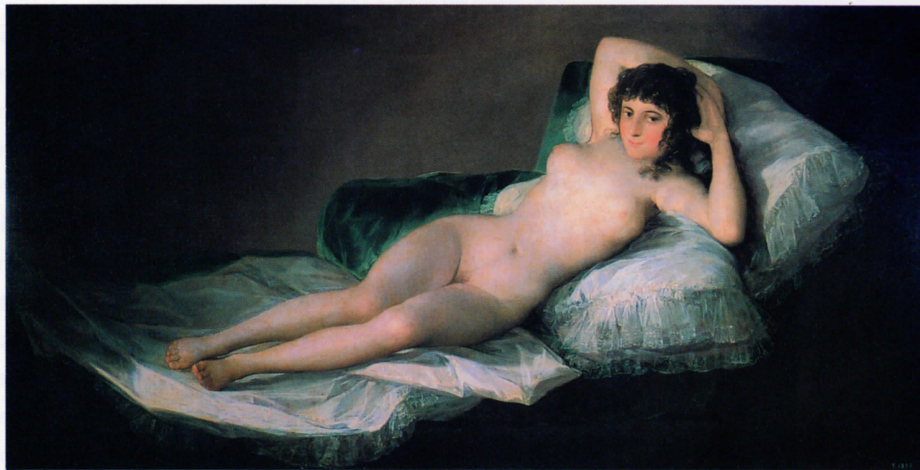
Encargo de un Don Juan: La maja desnuda , hacia 1789-1805. Óleo sobre lienzo, 97 x 190 cm. Museo del Prado, Madrid

La singularidad y osadía de La maja desnuda reside en que Goya representó el cuerpo desnudo sin ningún tipo de relación alegórica, mitológica o religiosa y con ello rompió con la tradicional forma de pintar desnudos, que tenía