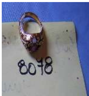
(310) Anillo perteneciente a Juan Manuel de Rosas (colección Terrero) Complejo Museográfico Enrique Udaondo.