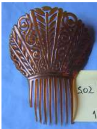
(292) Peinetón perteneciente a Manuelita Rosas (colección Terrero) Complejo Museográfico Enrique Udaondo