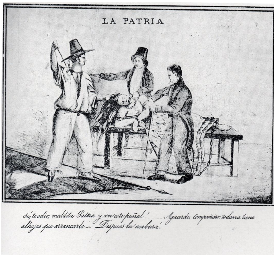
La patria, ilustración de "El grito Argentino", Nº 1, Montevideo, 24 de febrero de 1839.

La primera representación de la Patria encabeza el periódico. Desde la portada en clave neoclásica se observa a una mujer: la Patria montada en un carro de reminiscencias clásicas lanzada la carrera hacia adelante junto con la bandera flameante. La mano derecha se acerca a la bandera y con la izquierda sostiene un cuerno de la abundancia. Está vestida a la griega, el peplos descolocado muestra el hombro izquierdo y probablemente el seno que el brazo izquierdo cubre